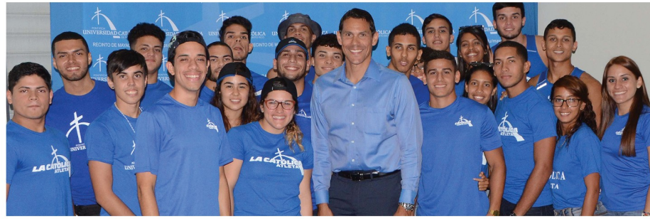
Atletas Pioneros celebran el Pep Rally con el director atlético.